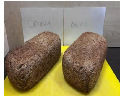
Fotoğraf 4. Ekşi Mayalı ve Kombucha Çayı İlave Edilerek Yapılmış Ekşi Mayalı Ekmeğin Bütün Haldeki Formları

Tablo 3’te yer alan reçete incelendiğinde, bu çalışmada kombucha çayının ekşi maya hazırlığında kullanılmasının temel gerekçesinin fermentasyon sürecine farklı bir mikrobiyal ve kimyasal yapı kazandırmak olduğu görülmektedir. Kombucha çayı, siyah veya yeşil çayın tatlandırılması ve ardından maya–bakteri simbiyotik kültürü (SCOBY) ile fermente edilmesi sonucu oluşan, organik asitler ve uçucu bileşikler bakımından zengin bir içecektir. Fermentasyon sonunda oluşan asetik asit, glukonik asit, laktik asit ve etanol gibi bileşiklerin hamurun pH’ını düşürerek maya aktivitesini, gaz üretim sürecini ve hamur gelişimini etkileyebildiği literatürde belirtilmektedir (Jayabalan vd., 2014; Marsh vd., 2014; De Vuyst ve Neysens, 2005). Bu nedenle reçetede kombucha çayının kullanımı, ekme üretiminde