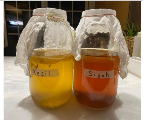
Fotoğraf 1. Fermantasyona Bırakılmış Yeşil ve Siyah Çaydan Yapılmış Kombucha Çayı Örneği (Çalışmada siyah çay ile yapılmış kombucha çayı kullanılmıştır.)