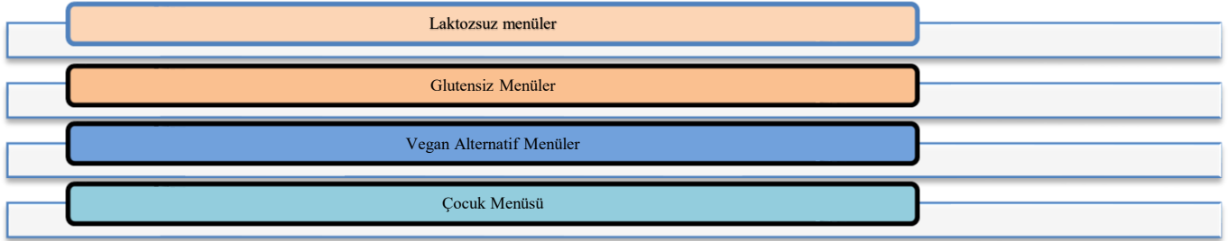
Şekil 1. Gıda Alerjisini Önlemek için Alternatif Menü Çeşitleri

s. 437). Müşteriler, alerji bildirimlerini rahat bir şekilde ifade edebilmek için işletmelerin teşvik edici bir tutum sergilemesi gerekmektedir. O yüzden işletmeler hem müşteri memnuniyetini artırır hem de riskleri en aza indirebilmektedir. Bu yüzden de özel diyet veya alternatif menüler oluşturulması gerekmektedir (şekil 1). Örneğin; menülerde glütensiz un, laktozsuz süt gibi malzemeler kullanılarak tatlı ve yemek alternatif menüler oluşturulabilir. Hayvansal ürünlere alerjisi olanlara vegan seçenekler sunulabilir. Çocuklarda yaygın olarak görünen gıda alerjilerine yönelik menüler hazırlanabilir. (Akay & Yılmaz, 2020 s.450).