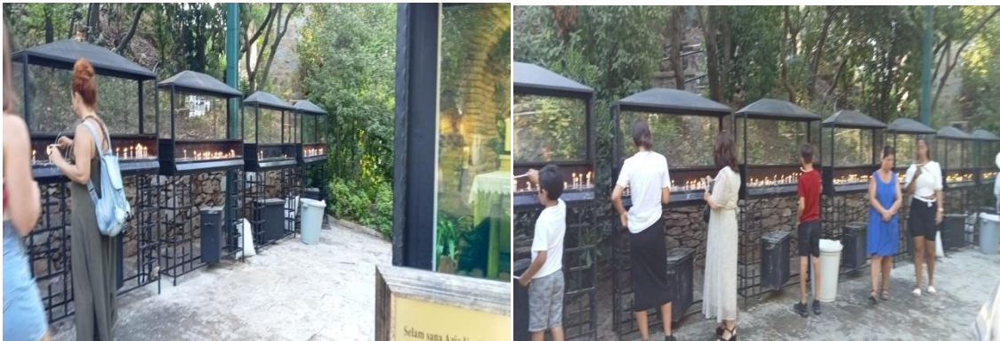
Resim 3. Mum Yakılan Alan

Hristiyanlar için kutsal gün olan 15 Ağustos Meryem Ana’nın Göğe Alınma Günü’nde Meryem Ana Evi’ne hac ziyareti amacıyla gelen tüm ziyaretçilere yönelik tüm gün gözlem yapılmış ve fotoğraf ve video çekilmiş, notlar alınmıştır. Gözlem sırasında Meryem Ana Evi’ne giren katılımcıların önce Hz. Meryem’i selamladıkları, diz çökerek ya da ellerini açarak dua ettikleri görülmüştür. Kimi katılımcılar duygu seline kapılmış, ağlayarak kapıdan çıkmıştır. Katılımcıların sol tarafta mum yakıp ellerini açarak uzun süre dua ettikleri görülmüştür.