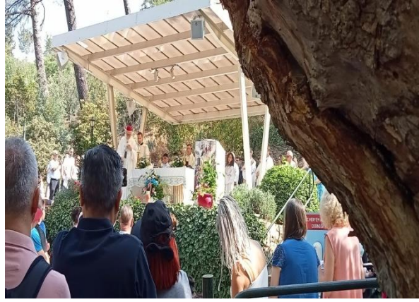
Resim 2. Meryem'in Göğe Yükselişi Günü'ne Katılan Ziyaretçiler