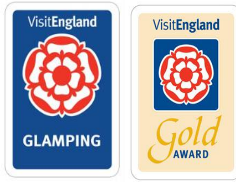
Şekil 2. VisitEngland akreditasyon logosu ve altın ödül logosu

Bir glamping işletmesinin akreditasyon elde ederek ve VisitEngland kalite logosunu web sitesinde sergileyebilmesi için gereken hizmetleri ve özellikleri sağlayarak tüm alanlarda gerekli kalite standardını karşılaması gerekecektir. Akreditasyon ve altın ödül puanlaması için bilgi ve varış, dış görünüm, yataklar, banyolar, mutfak, yaşam alanı, aydınlatma- ısıtma ve soğutma, kat hizmetleri ve temizlik olmak üzere 8 ana kategori ve 18 alt kategoriden oluşan değerlendirme kriterleri Tablo 3’te sunulmaktadır (VisitEngland, 2022).