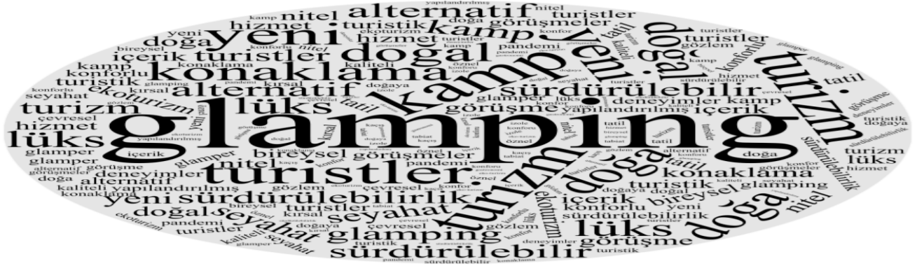
Şekil 1. Çalışmaların Özetlerine İlişkin Kelimelerin Dağılımı

Şekil 1’de “Glamping Turizm” alanında yapılan çalışmaların özetlerine ilişkin bir değerlendirme yapılmıştır. Tüm özetler Microsoft Excel programında sentezlenerek WordCloud aracılığıyla kelime bulutuna dönüştürülmüştür. Daha sonrasında ve, ile, dahi gibi bağlaçlar ve birbirine benzer kelimeler çıkartılarak düzenleme yapılmış ve bunun sonucunda 42 ayrı kelimenin kullanıldığı gözlenmiştir. En çok kullanılan kelimeler ise glamping, turizm, turistler, doğa, doğal, sürdürülebilirlik, lüks, alternatif gibi kelimeler olmuştur. Yukarıdaki yer alan Şekil 1’den anlaşılacağı üzere glamping turizmi ile yapılan çalışmaların özetinde kullanılan kelimeler aslında glamping turizminin tanımına yönelik bir fikir de sunmaktadır. Bununla birlikte yapılan çalışmaların göreceli olarak nitel ve görüşme yoluyla gerçekleştiği kelime bulutundan anlaşılmaktadır.