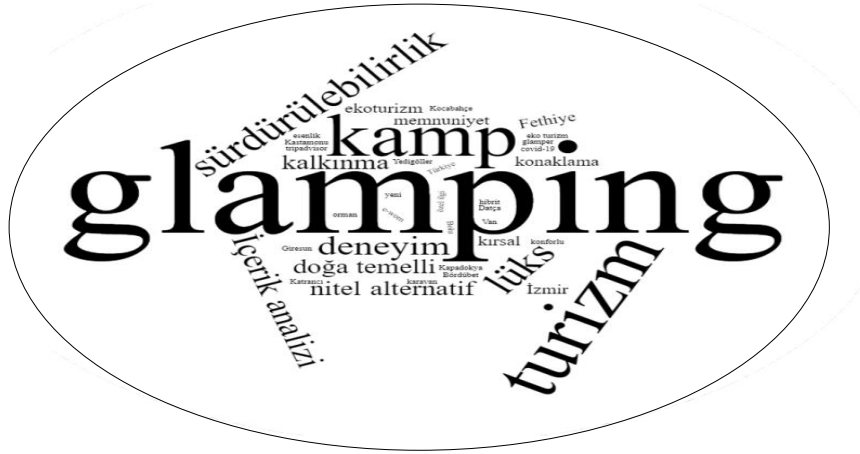
Şekil 2. Çalışmaların Anahtar Kelimelerine İlişkin Dağılımı

Glamping turizm alanında gerçekleştirilen çalışmaların anahtar kelimelerinin dağılımı incelenmiş ve Şekil 2’de kelime bulutu olarak verilmiştir. Toplam 143 anahtar kelime öncelikle Microsoft Excel programında sentezlenmiş, sonrasında Word Clouds’a yüklenerek analizi gerçekleştirilmiştir. Sürdürülebilirlik, sürdürülebilir gibi benzer kelimeler tek bir kelime altında toplanmıştır. Bütün çalışmalarda glamping anahtar kelimesi kullanılmıştır. Sonrasında turizm, sürdürülebilirlik ve kamp kavramları en sık kullanılan anahtar kelimelerdendir. Alternatif turizm, özel ilgi turizmi, Covid 19, sürdürülebilir turizm, yeni turizm trendleri, doğa temelli turizm, kalkınma, eko turizm ve kalkınma kullanılan anahtar kelimeler arasındadır. Bu durum glamping turizm ile yapılan çalışmaların bu konularla birlikte ele alındığını da ortaya koymaktadır.