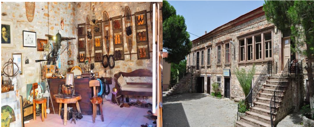
Foto 1.Küçükköy Kent Müzesi’nin İçten ve Dıştan Görünümü

Küçükköy 2019 yılı itibari ile Ayvalık ilçesine bağlı bir mahalle olup, Ayvalık merkez, Alibey Adası, Şeytan Sofrası ve Sarımsaklı Plajı gibi turistik çekim merkezlerine oldukça yakın mesafededir. Kiliseden dönüştürülen Merkez Cami ve Küçükköy Kent Müzesi en fazla ziyaretçi çeken kültürel varlıklar arasındadır. Müzede, Balkanlar’dan göç eden Boşnakların göç sırasında getirdikleri giysiler, dokümanlar, mutfak eşyaları, dikiş makinaları ve daha çok sayıda eşya sergilenmektedir. Müzenin kuruluş amacı gelecek nesillerin tarih bilincini geliştirmektir. 2010 yılında Küçükköy Belediyesi öncülüğünde oluşturulan müzede tarihi objelerin yöre halkı tarafından gönüllü olarak yetkililere teslim edilmesi ise sürmektedir.