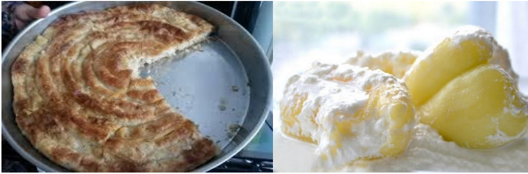
Foto 2. Boşnak Böreği ve Soka

Son yıllarda köyün turistik çekiciliğinin artmasıyla birlikte, köy sanat galerisi, heykeltıraş, ressam ve minyatür sanatı gibi sanatçı girişimciler için cazibe haline gelmiş bulunmaktadır. Bu sanatçıların bir kısmı Boşnak kültürünü yansıtan çalışmalar yapmakla birlikte, çoğunluğu sanatın evrenselliği ilkesi ile faaliyet yürütmektedirler.