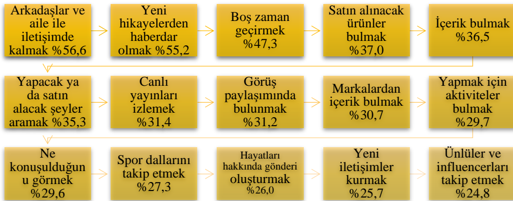
Şekil 3. Türkiye’de Sosyal Medya Kullanımının Nedenleri; Kaynak: We Are Social, Şubat 2022 Raporu

We Are Social (2022) ise Türkiye’de sosyal medya kullanım nedenlerini aşağıdaki yüzdelerle sıralamada raporlamıştır;