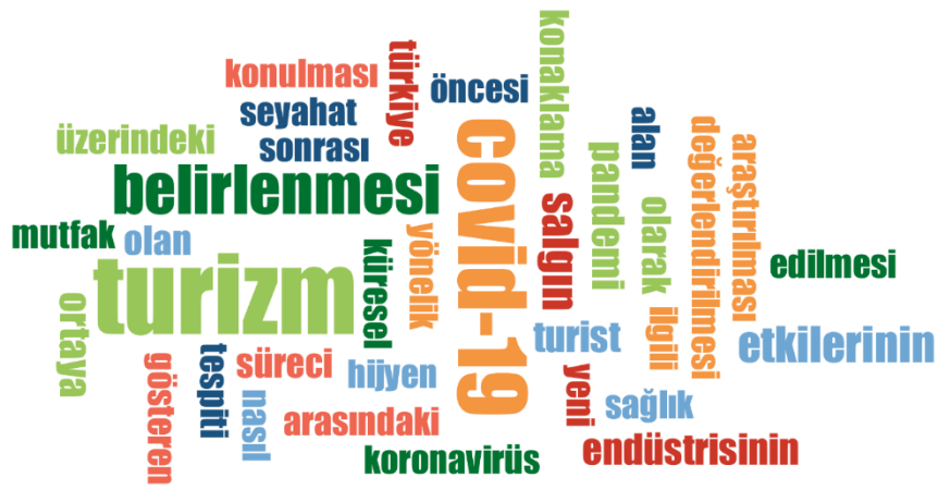
Şekil 4. Makalelerin Amaçlarına İlişkin Kelime Bulutu

İncelenen makalelere ilişkin sözcük frekansları ve kelime bulutları makalelerin araştırma konuları hakkında fikir vermektedir. Daha önce bahsedildiği üzere; Covid-19'un turizme etkileri, konaklama seyahat ve yiyecek sektörüne etkileri, uygulanan tedbirler gibi konularda yoğunlaşma olduğu tespit edilmiştir.