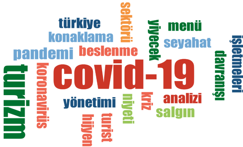
Şekil 3. Anahtar Kelimelere İlişkin Kelime Bulutu

Tablo 5’te en çok tekrar edilen anahtar kelimeler, bu kelimelerin metinde kaç yerde geçtiği ve ilgili kelimenin metnin yüzde kaçını oluşturduğuna dair bilgiler yer almaktadır. Bu bilgiler ışığında incelenen 86 makalenin 71’inin anahtarında kullanılan “Covid-19” kelimesi ilk sırada yer almaktadır. İkinci sırada yer alan “turizm” sözcüğü 59 ve üçüncü sırada yer alan “pandemi” sözcüğü 23 makalenin anahtarında yer almaktadır. En çok tekrar edilen kelimelerin başında “Covid-19, turizm, pandemi, koronavirüs” sözcükleri gelmektedir.