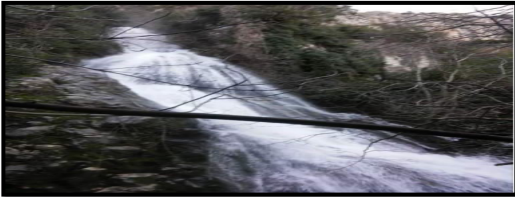
Şekil 5: Yağışlı Dönemde Ayvaini Mağarası Çıkış Ağzı

Ayvaini Mağarası, geniş bir alanda yüzey ve yeraltı sularını toplayan yapıdadır. Mağaranın ağız kısmı olan düdenden giren yüzey suları ve mağara içine süzülen sular, Ayva Köyü'nden çıkmaktadır. Bu noktadan sonra Yeşildere adını almakta ve RAMSAR sözleşmesi ile koruma altında bulunan Uluabat Gölü'nü beslemektedir. Yağışın çok olduğu dönemlerde, mağaranın çıkış ağzından sular birleşerek tek bir nehir halini almakta ve tecrübeli sportif ekipler için bile tehlike arz etmektedir (Çevre ve Orman Bakanlığı Doğa Koruma ve Milli Parklar Genel Müdürlüğü, 2011). Şekil 5, yağış döneminde mağaranın çıkış ağzından akan suları göstermektedir.