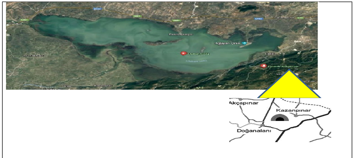
Şekil 1: Ayvaini Mağarası Giriş ve Çıkış Ağzı Coğrafik Konumu

Çalışmaya konu olan Ayvaini Mağarası düden girişi, Bursa ili, Mustafakemalpaşa ilçesi Doğanalan Köyü, kaynak çıkışı Bursa ili, Nilüfer ilçesi Ayva Köyü’nde bulunur. Mağaranın ana galerisi, 4.900m; fosil galerisi 600m uzunluğundadır ve giriş kotuna göre, en derin kısmı -80m derinliktedir (Ozansoy & Mengi, 2006, s. 220). Şekil 1, Ayvaini Mağarası’nın coğrafik konumunu göstermektedir. Uluabat Gölüne yakın çıkış ağzı Ayva Köy’de olup, haritada işaretlidir. Giriş ağzı ise Doğanalan Köyü ile Kazanpınar arasındadır ve Şekil 1’de kesit olarak gösterilmektedir.