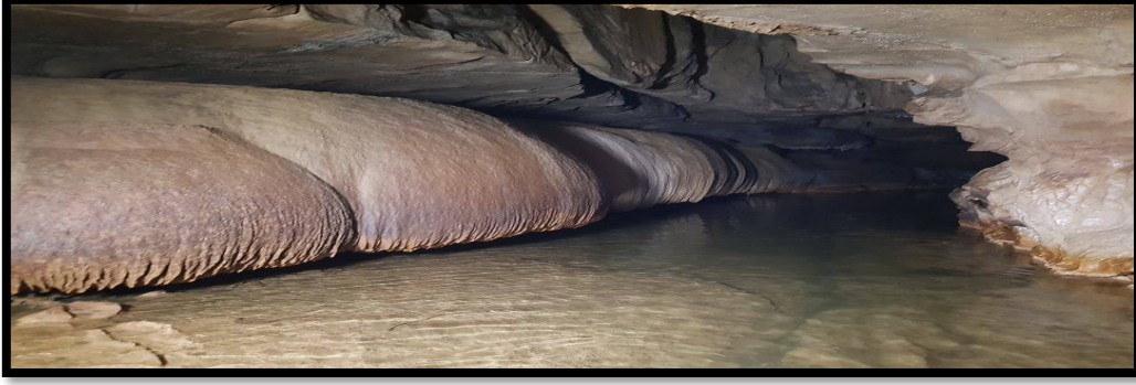
Şekil 4: Ayvaini Mağarası İç Kısmı

Şekil 4, mağara içerisindeki su havuzlarına örnektir. Mağara içerisinde yağışlı dönemde suyun olması ile Ayvaini'nin aktif bir mağara olduğu söylenebilir, su mağaraya şekil vermeye devam etmektedir.